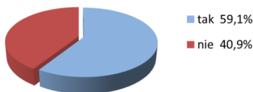
Rysunek 2. Wpływ kursów międzypokoleniowego uczenia się z wykorzystaniem narzędzi ICT i cyberprzestrzeni na wzrost znaczenia wykształcenia wśród uczniów z rodzin imigranckich

Projekt trwał za krótko, by można było śledzić dalsze losy edukacyjne dzieci i młodzieży biorących udział w kursach międzypokoleniowego uczenia się, i określić, czy miał on istotny wpływ na organicznie wśród nich zjawiska porzucania nauki. Jednak ze stanowisk wyrażonych przez uczniów z rodzin imigranckich wynika, że opinia większości z nich na temat edukacji zmieniła się i w przyszłości będą dążyć do pomyślnego przejścia przez przynajmniej podstawowe etapy formalnego kształcenia. Na pytanie „Czy Twój udział w projekcie przyczynił się do wzrostu znaczenia formalnej edukacji w Twoim życiu?” 59,1% dzieci i młodzieży zadeklarowało, że tak, a 40,9% było przeciwnego zdania.