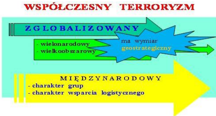
Rysunek 2. Cechy współczesnego terroryzmu ponowoczesnego

Katalog ten nie jest zamknięty, ponieważ bardzo szybko tworzą się nowe typy zagrożeń w społeczeństwie informacyjnym.