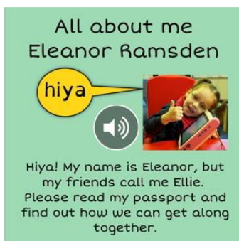
Rysunek 1. Digital Passport

By ułatwić specjalistom wykonanie paszportu, pojawiły się jego wersje cyfrowe. Ułatwiają one proces przygotowywania paszportu i systematycznego wprowadzania do niego zmian, pozwalając na równoczesne wykorzystanie danych multimedialnych, tj. nagrań audio i wideo. Jednym z narzędzi tego typu jest Digital Passport (rys. 1) autorstwa szkockiej firmy Pamis. Niestety na rynku polskim nie można spotkać odpowiedników podobnych aplikacji.