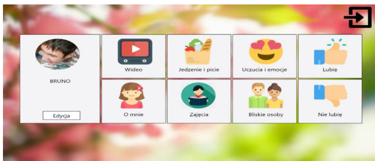
Rysunek 2. Okno główne Multimedialnego Paszportu Komunikacyjnego

jest zapewnienie możliwości szybkiego skontaktowania się z kimś, kto dobrze zna właściciela paszportu. Zapewnia to kafelek Bliskie osoby . Wewnątrz można dodać zdjęcia takich osób wraz z krótkim komentarzem pod każdym z nich.